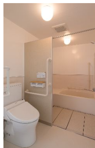
↑全室バス・トイレ付